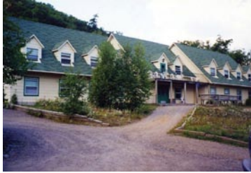
En auberge (chambre)