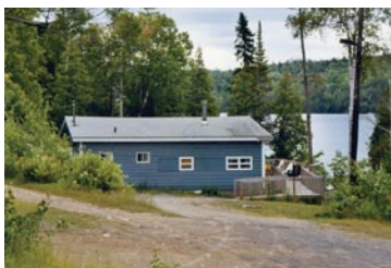
En chalet collectif (chambre)