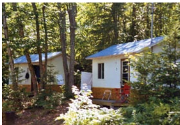
En chalet individuel